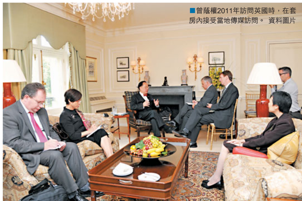
曾蔭權2011年訪問英國時，在套房內接受當地傳媒訪問。

同時，曾蔭權於2011年11月訪問美國檀香山時，特首辦本來決定為曾特首租住檀香山希爾頓威基基海灘酒店的單房山景總統套房，1晚房租為1,368美元，