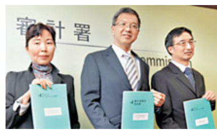
審計署指特首多次外訪欠足夠理據住總統套房。圖為鄧國斌。

審計署於4月底應特首辦邀請，檢視特首外訪住宿安排的機制。審計署署長鄧國斌、副署長伍梁慧芬昨日舉行記者會，公布報告書內容：特首並沒有參與任何外訪住宿安排的決策，酒店和住宿等級由特首私人秘書決定，並由她安排向特首發放膳宿津貼。報告並引述特首私人秘書稱，她毋須就所選酒店和房間類型徵詢行政長官的意見，曾蔭權一向亦無就他屬意的酒店和住宿等級發出指示。