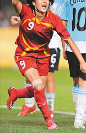
韓端為中國隊貢獻了106個入球。