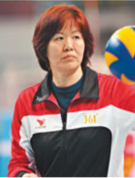
郎平稱中國女排入「死亡之組」，不一定完全是壞事。

組出線帶來不少懸念。對於中國女排來說，這樣的分組意味着從奧運會開始就要投入進去，小組賽也沒有什麼喘息的機會。不過，這樣也不一定是壞事，在這樣的「死亡之組」突出重圍殺進前8，之後的8進4對手可能相對容易打，處理好了進前4的形勢就會比較樂觀。 在北京奧運會上率領美國隊奪得銀牌的郎平認為，中國隊所在的這個小組各隊實力比較平均，都有一定衝擊力。所以，小組預賽對球隊有一定的考驗，不過她相信中國隊一定可以小組出線，可能只是一個排名問題。郎平也覺得分在「死亡之組」不一定完全是壞事，小組的對手強一點，交叉賽會相對輕鬆。在她看來，中國隊進前8之後交叉碰A組的任何一支隊，就算是俄羅斯、意大利，也都不是不可戰勝的。 此前有媒體報道說，12支倫敦奧運會參賽隊伍中排名後4位的球隊將通過抽籤進入A、B組，對此貝克沒有提及。貝克表示，倫敦奧運會的女排最終賽程將於6月18日出爐。