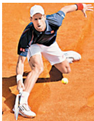
■祖高域滑步救球。