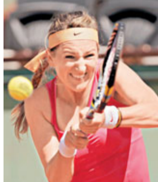
■阿薩蘭卡在次圈未有受到考驗。