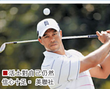
■活士對自己仍然信心十足。

美國高爾夫球名將「老虎」活士近日在聊天室向粉絲表示，指自己即使已年屆36歲，仍有信心和有很多時間可以超越「金熊」尼克勞斯所保持的四大滿貫18次奪冠的輝煌紀錄。現時活士已經奪得14次大滿貫賽事的冠軍，比「金熊」