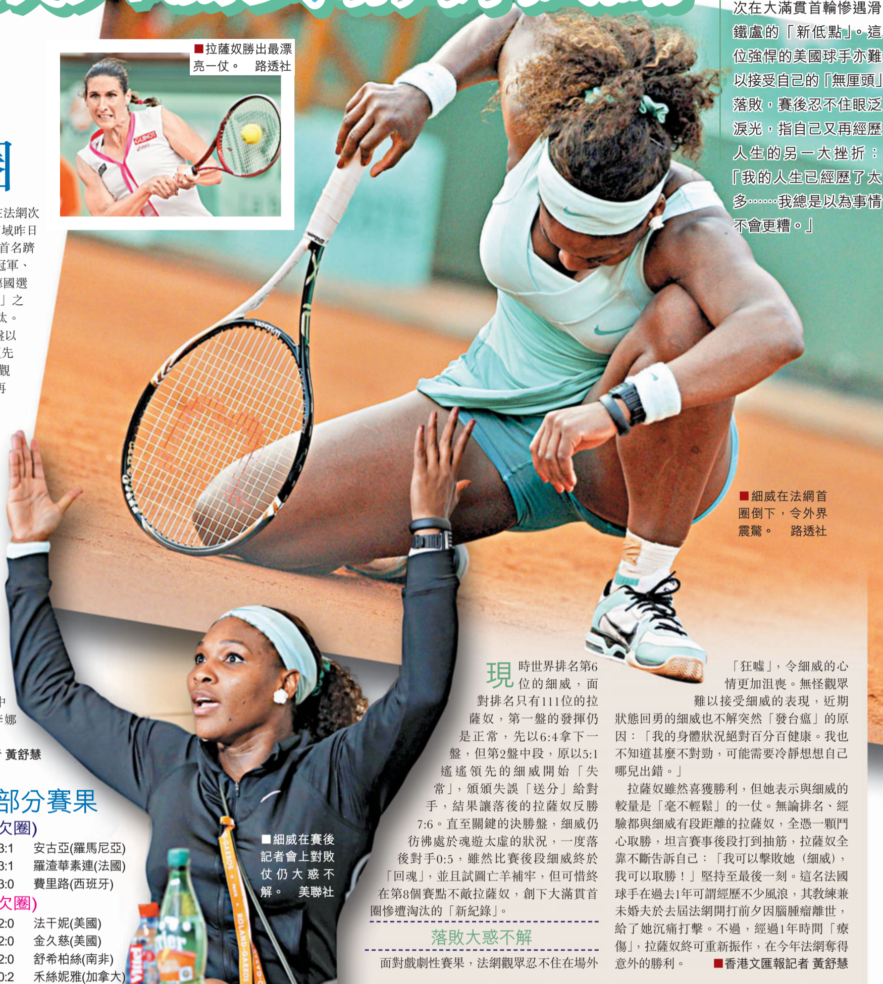
■細威在法網首圈倒下，令外界震驚。