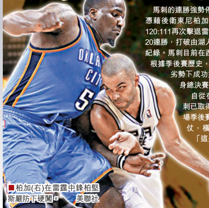
■柏加(右)在雷霆中鋒柏堅斯嚴防下硬闖。

馬刺的連勝強勢停不了，周二在第2場西岸決賽，憑藉後衛東尼柏加轟進全場最高的34分，主場以120:111再次擊退雷霆，橫跨常規賽和季後賽已錄得20連勝，打破由湖人在2000/01年球季保持的19連勝紀錄。馬刺目前在西岸決賽以總盤數2:0領先雷霆，根據季後賽歷史，只有14支球隊能在落後首2場的劣勢下成功逆轉，預料馬刺極有機會再次躋身總決賽，衝擊球隊史上第5個總冠軍。自從在上月11日於主場負湖人後，馬刺已取得20場全勝(包括10場常規賽和10場季後賽)，賽後馬刺球星鄧肯希望多勝2仗，橫掃雷霆躋身總決賽。鄧肯說：「這是很好的連勝，但如拿下22連勝將會很棒。」鄧肯是役貢獻11分、12個籃板球和4次封阻，季後賽生涯的封阻次數累積至472次，追平火