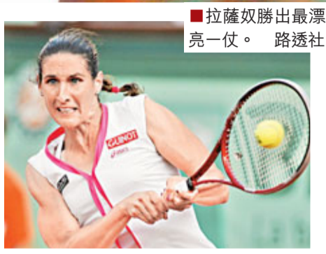
■拉薩奴勝出最漂亮一仗。

女單方面，阿薩蘭卡挾澳網冠軍之勢愈戰愈勇，次圈迎戰從外圍賽晉級的費絲美亞，「一姐」僅用了55分鐘的時間便以6:1和6:1的成績擊敗對手，晉級可謂易如反掌。阿薩蘭卡賽後表示：「我真的不太清楚今日的對手，我要用幾局去了解她的打法，此後我開始找到比賽節奏。」