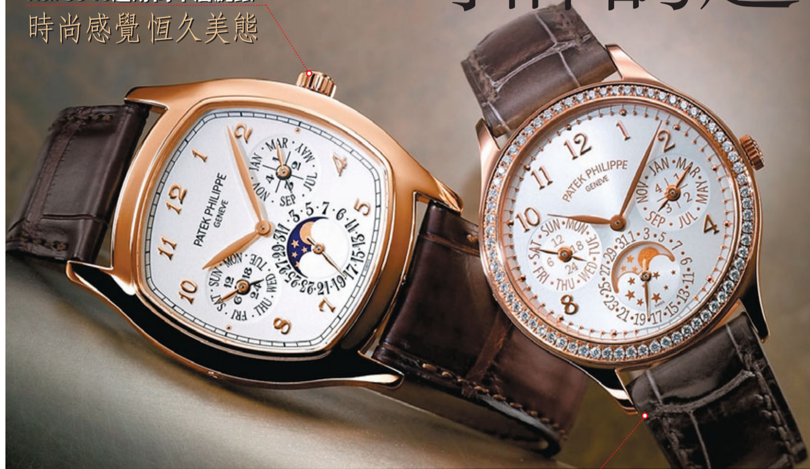
Ref. 7140 Ladies First萬年曆腕錶