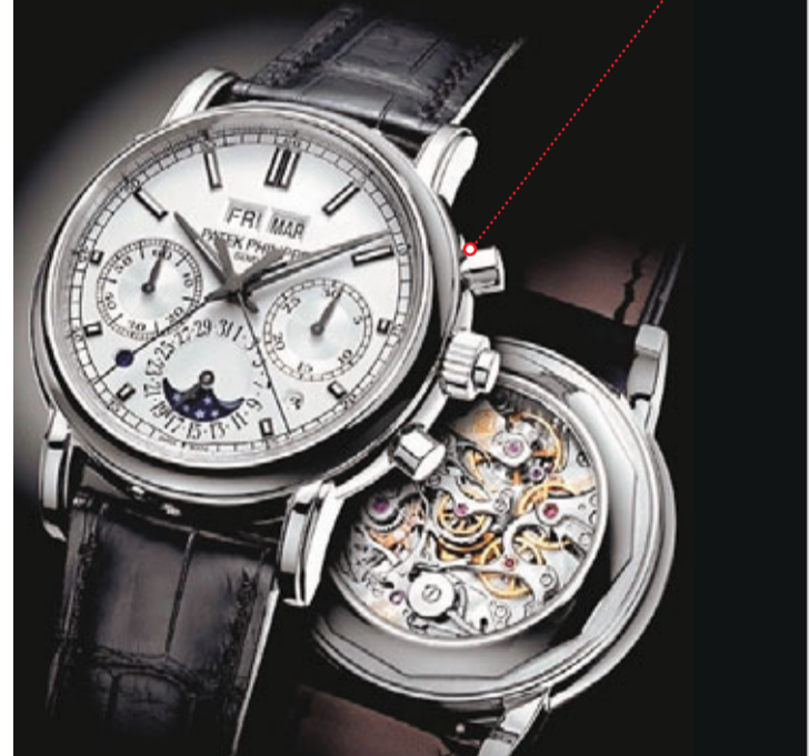
Ref. 5204萬年曆功能雙針計秒計時秒錶 複雜功能叫人讚嘆

PATEK PHILIPPE 經典的人手上弦計時秒錶機芯，由橫向離合器及導柱輪操控，漸次以三種複雜程度的款式登場，正是品牌一貫奉行的傳統。現在，旗下的專利計時秒錶機芯將加添萬年曆及雙針計秒兩大備受歡迎的複雜功能，製成頂級複雜功能的版本應市，機芯型號CHR 29-535 PS Q。萬年曆裝置(Q)倚靠一年前隨編號5270計時秒錶問世的同一結構運作。至於雙針計秒計時秒錶裝置(R)方面，PATEK PHILIPPE 的工程師把原來的設計大加改造，換上嶄新的雙針計秒隔離器，減少移動的質量，消除軸承的壓力，有助擺輪的擺幅穩定不變；另起用一個專利工具，發揮均等化的效果，確保計時秒針與雙針計秒指針重疊精確。乳白色金製錶面之下，蘊藏全組微型機械裝置，實在叫人讚嘆不已。腕錶特備寶石玻璃錶殼底蓋，機芯細節一覽無遺。若然錶主希望藏起機芯的炫目美態，亦可为腕錶換上鉑金錶殼底蓋。