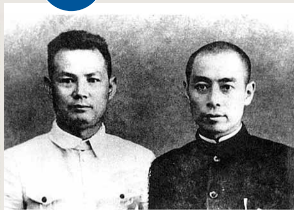
葉劍英(左)和周恩來。