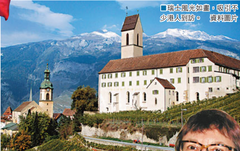
瑞士風光如畫，吸引不少港人到訪。資料圖片

香港文匯報訊(記者張易) 香港回歸15周年前夕，瑞士駐港總領事吳凱睿接受本報專訪時指，回歸後瑞港經貿紐帶變強，帶動手錶、珠寶等更多瑞士產品轉口中國內地，即使亞洲金融風暴和「沙士」期間，本港瑞企數量仍保持穩定，顯示瑞士對港經濟信心不變。她又指，相信歐盟有能力解決歐債危機，支持緊縮與增長並重。