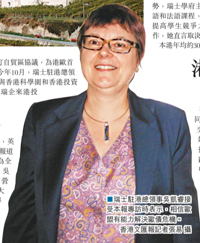
瑞士駐港總領事吳凱睿接受本報專訪時表示，相信歐盟有能力解決歐債危機。

全球金融業中心東移，英國《金融時報》本年3月報道稱，香港已超越倫敦，為全球寫字樓租金最貴城市。吳凱睿稱，昂貴租金推高營運開支，為瑞企最大心患，認為香港可做得更好。她亦指，為改善營商環境，港應優化空氣質量，並增建國際學校吸引海外人才。