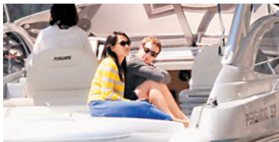
朱克伯格與妻子普麗西拉乘坐豪華遊艇。