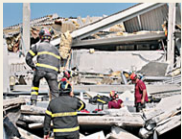
地震令不少房屋倒塌。

意大利北部艾米利亞地區的地震，截至當地時間昨日上午，已造成至少16人遇難，350多人受傷，以及1人失蹤。中國駐米蘭總領事館核實，一名來自中國浙江的男僑胞不幸遇難，暫未有其他中國公民傷亡的消息。意震區多名華人的房屋受到不同程度損毀，震區的小型華企也蒙受經濟損失。