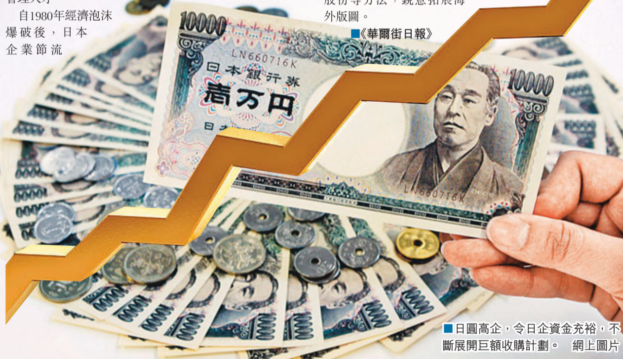
日圓高企，令日企資金充裕，不斷展開巨額收購計劃。網上圖片