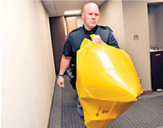
警方到場調查，檢走一袋物品。

加拿大執政保守黨總部前日接連收到恐怖郵包。員工打開郵包時，發現內有血跡並傳出惡臭，渥太華警方證實內藏一隻人體斷腳，正全力追查郵包來源。