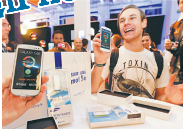
柏林粉絲買得新電話，超興奮。

三星昨天率先在歐洲及中東28國推出最新旗艦智能手機Galaxy SIII。新機此前傳出預售反應佳，英國電訊商Vodafone亦稱，預訂需求比以往任何一部Android機更多。首部Galaxy機2010年推出，較第一代iPhone遲了3年，但近年三星大有超越蘋果公司之勢。有科技網站實機測試後便認為，SIII比iPhone 4S「超前幾光年」。