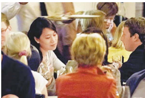
朱仔朱太在餐廳心事重重，莫非在想着fb股價插水？