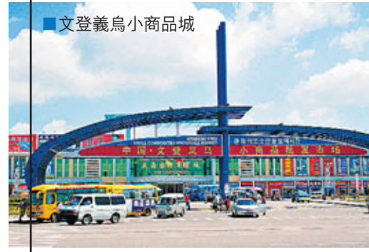
文登義島小商品城

大的發展後勁。文化、旅遊、養生三大朝陽產業快速發展，引進建設了香港世威國際旅遊度假島、大溪谷文化創意基地、上海禧禧樂等項目，成功舉辦了養生產業峰會暨國際溫泉節、全國群眾登山健身大會等活動，打響了「中國長壽之鄉、濱海養生之都」城市品牌。農業產業化發展邁出新步伐，着力打造皮革、西洋參等十大產業鏈條，狠抓農業龍頭企業建設，促進了現代農業快速發展。 在推進項目集聚的過程中，文登注重以提升自主創新能力促進產業升級，推動政產學研結合，創新體系日臻完善。目前，全市共建起了30個省級以上企業研發中心、院士或博士後工作站。去年，實施了34個產學研合作項目，有22個項目列入省以上技術創新計劃，職務專利申請量是去年的2倍多。 隨着文登打造藍色產業新城的強勢崛起，來自港台、日韓、歐美等客商更加青睞文登，紛紛到文登投資創業，實現發展共贏。「要成功，到文登」已經成為越來越多投資者的共識。