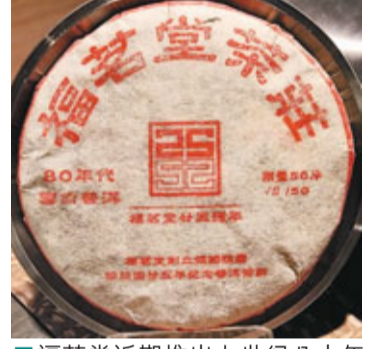
福茗堂近期推出上世紀八十年代出廠的普洱茶餅。

普洱茶有生茶和熟茶之分，生茶是鮮茶葉經過殺青揉捻、毛茶乾燥成為生散茶，然後壓製成茶餅。生茶又稱後發酵茶，因其自然發酵，沒有經過人工的發酵程序。熟茶是生散茶經過人工快速後熟發酵、灑水渥堆工藝後壓製成型的。