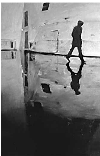
■情愫浪漫主義系列，2011-10