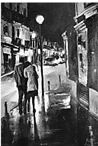
■情愫浪漫主義系列，2011-4

畫面中的自行車，你無從判斷這個主人公的具體年齡，也無法判斷他的具體職業，更無法明確知道他要去哪裏地方。但可以確定的是，自行車給了他一種身份——普通人。正是普通人的生活，見證了藝術的偉