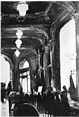
■情愫浪漫主義系列，2011-6