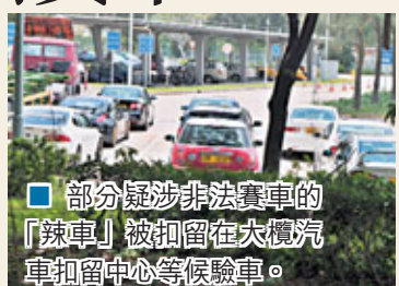
■部分疑涉非法賽車的「辣車」被扣留在大埔汽車扣留中心等候驗車。

香港文匯報訊（記者 杜法祖）非法賽車活動持續猖獗，警方鐵雷厲打擊。25輛疑曾非法改裝的「辣車」，昨凌晨由長沙灣沿大埔道一直狂飆至大埔，懷疑進行非法賽車，但被早作部署的警方新界北總區交通部特遣隊於大埔科學園附近截獲。涉案車輛事後全被拖走驗車，警方稍後會對有關人士作出檢控。