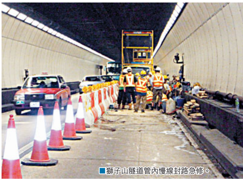
■獅子山隧道管內慢線封路急修。

香港文匯報訊（記者 杜法祖）獅子山隧道出九龍管道月前發生三級火警的慢線路面，近日又出現損毀下陷，當局昨晚開始封閉受影響路段緊急維修，引致獅隧公路出九龍方向昨晨交通大擠塞，龍尾伸延至新田圍邨附近。路政署發言人指出，復修工程通宵進行，預計今晨6時早上繁忙時段前完成，重新開放管道通車。