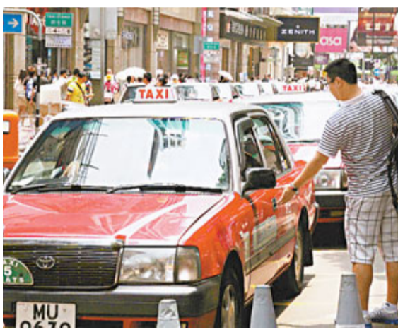
41個的士團體昨日發表聲明,促請運輸署盡快處理加價申請。

運輸署盡快恢復處理加價申請,但預料的士加價計劃難以於今年內落實,最快明年才完成申請程序。