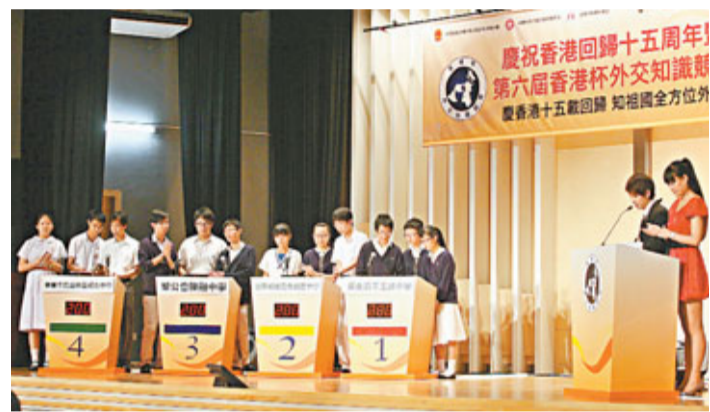
第六屆香港杯外交知識競賽準決賽昨日舉行,16支入圍隊伍經過多輪激烈比賽決出6強席位,進入7月舉行的決賽爭奪冠軍。

香港文匯報訊(記者 劉景熙)由外交部駐港特派員公署、教育局及香港明天更好基金合辦的「第六屆香港杯外交知識競賽」,昨日順利舉行準決賽。經過一番激烈角逐,聖公會陳融中學、英華書院、保良局百周年李兆忠紀念中學、聖言中學、皇仁書院及衛冕冠軍浸信會呂明才中學成為最後6強,晉級7月7日的總決賽爭奪冠軍。