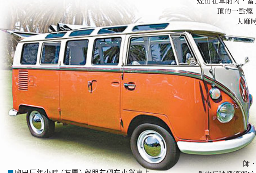
奧巴馬年少時(左圖)與朋友們在小貨車上吸食大麻。上圖為同類型的小貨車。網上圖片

上任後嚴懲濫藥的美國總統奧巴馬,原來年輕時是大麻愛好者。自傳作家馬立尼斯所寫的《奧巴馬故事》一書指,奧巴馬在檀香山讀高中時,不但是「大麻黨」成員,更自創吸食方法。