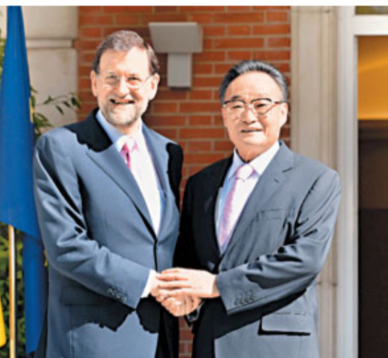
■25日,吳邦國會見西班牙首相拉霍伊。

吳邦國是次訪問的國家包括荷蘭、克羅地亞、盧森堡和西班牙。BBC報道稱,原本行程還包括英國,但鑒於5月中旬,達賴在英國倫敦聖保羅大教堂領取鄧普頓獎以及110萬英鎊的獎金,並與卡梅倫「私下會面」,中國決定取消吳邦國訪英活動。BBC報道稱,中方指此舉「嚴重干涉了中國內政,損害了中國的核心利益,傷害了中國人民的感情。」