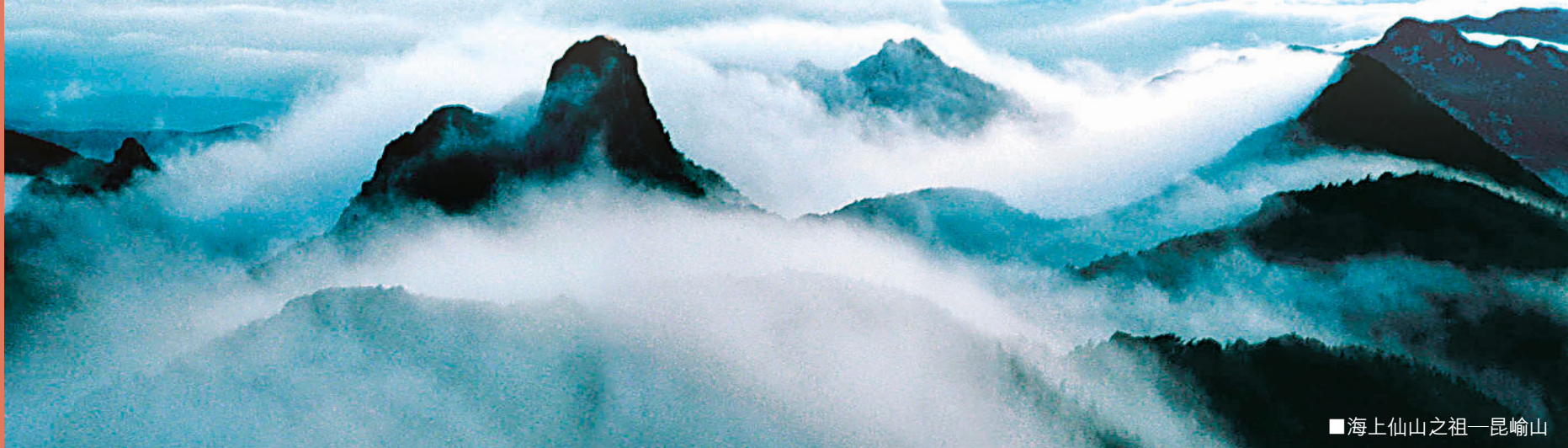
■海上仙山之祖——崑崙山

「文化之城,登高之地。」文登這座千年歷史文化名城正煥發出新的活力,步步登高。新一屆文登市委、市政府及全市人民真誠邀請國內外朋友到文登養生度假,投資創業,共同感受「中國長壽之鄉、濱海養生之都」的魅力。