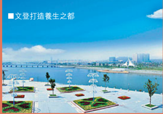
■文登打造養生之都