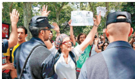
示威者抗議政府硬救Bankia，卻削減教育開支。

政府日前表示，會以國營銀行援助基金(FROB)協助Bankia進行重组。但重组最大阻礙不是銀行本身，而是Bankia母公司BFA集團。BFA將所持Bankia股份估值為120億歐元(約1,167億港元)，較市價31億歐元(約301億港元)高出近3倍。