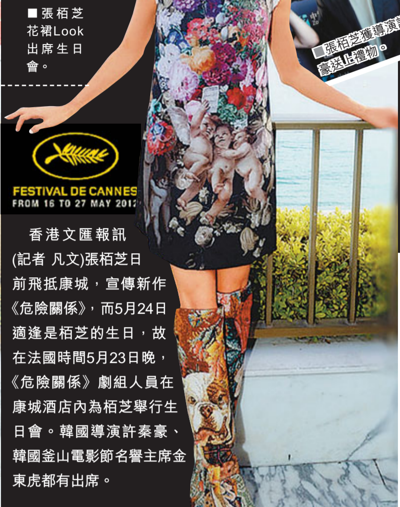
張栢芝花裙Look出席生日會。