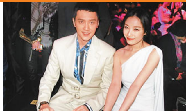
馮紹峰在微薄公佈與倪妮的戀情，獲大家祝福。

香港文匯報訊 (記者 顧一丹 廣州報道)馮紹峰昨日在官方微博大方公開與倪妮戀情，稱：「老天讓你等，是為了讓你遇到對的人，現在很幸福！上蒼眷顧，感恩！」最後加上倪妮名字，直指倪妮就是他所遇上對的人。近十萬網友紛紛在微博中送上祝福！倪妮的經紀人蒲小姐表示，倪妮和馮紹峰在一起後特別開心，兩人十分般配。