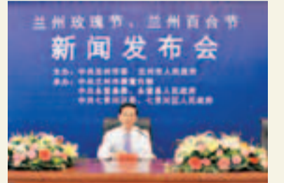
■新聞會現場。

香港文匯報訊(記者肖剛蘭州報導)甘肅省蘭州市日前舉行新聞會,素有「玫瑰之鄉」美譽的永登縣和「百合之鄉」七里河區分別於5月18日和6月26日舉辦為期月餘的2012中國玫瑰之鄉、蘭州玫瑰節和首屆蘭州百合文化旅游節,主辦方希望通過旅遊節期間豐富多彩的文化、體育以及經貿活動讓遊客沉醉於「玫瑰的嬌艷」和「百合的芬芳」。