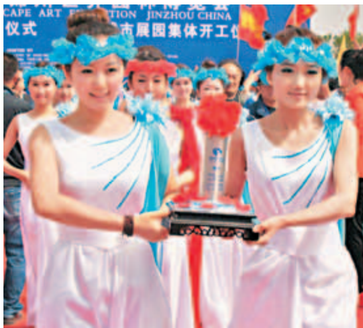
■錦州世博園主會場漂流瓶由志願者在錦州景區筆架山的海岸旁放入大海。

面積約7平方公里,其中陸地面積3.3平方公里,水域面積3.7平方公里,是全球最大的博覽園區之一,也是2006年瀋陽世園會後,東北地區規格最高、規模最大的世界級展會。