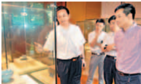
■平頂山市委常委、汝州市委書記李全勝陪同媒體團參觀汝瓷博物館。

香港文匯報訊(記者戚紅麗、沙苗苗汝州報導)汝州市委、市政府日前主辦中央及香港駐豫媒體「走基層——汝州行」活動,邀請包括