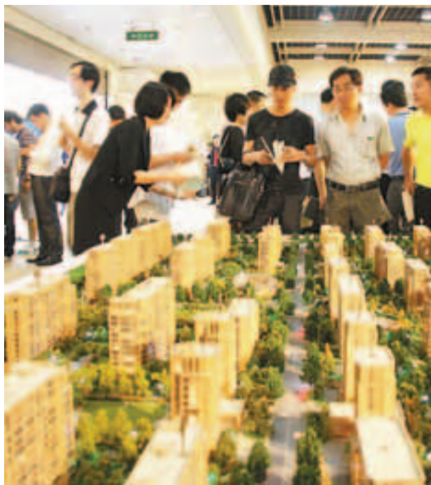
樓盤模型前駐足觀看的參觀者

近兩個月來，杭州房市連續的降價還是拉動了一批剛需購房者。4月的第二個星期杭州商品成交周環比增長甚至達到了34%。而庫存房源也有所下降，從3月底的80199套，到4月30日的79320套，減少了879套。雖然沒有花幾百萬在會館內買下展位，許多房產公司還是藉着展會的機會用發傳單或是打移動廣告的方式推出各自的樓盤。而在其中一個展館世貿中心旁邊，更有幾家房企舉辦了一個小型的「置業節」，吸引了不少原先來看人居展的購房者。儘管場內成交量成績慘淡，但人居展的舉辦卻推動了杭州樓