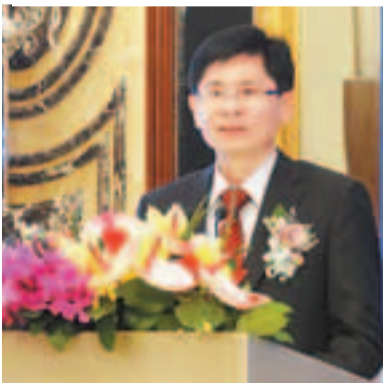
廣西壯族自治區政府副主席藍天立在香港簽署26項投資項目

香港文匯報訊(記者 孫雪、張蕾、李璐)廣西壯族自治區昨日(22日)在香港香格里拉酒店舉行廣西北部灣經濟區招商會，14個產業園區共179個項目參與推介，涉及製造、貿易、服務、地產、基礎設施建設等諸多領域，總投資1831.85億元(人民幣，下同)。會上有26個項目簽約，投資額達287.18億元，其中合同投資20.1億元。中華燃氣與中信大錳等在港上市公司分別擬在欽州和崇左投資新能源和鋁冶煉開發。