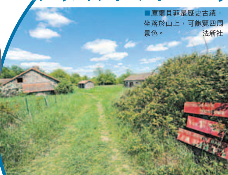
庫爾貝菲是歷史古蹟，坐落於山上，可飽覽四周景色。

法國荒廢已久的「鬼村」庫爾貝菲，多年來一直無人問津，直至前日，終由韓國攝影師Ahae在拍賣會上，以52萬歐元(約516萬港元)投得。據稱，Ahae在個人網站上表示，自己一直尋找一個可實踐「有機生活概念」的地方，讓大自然可不受人類活動影響，按自然規律發展；並將鬼村打造成既環保，又富藝術和文化氣色的地方。