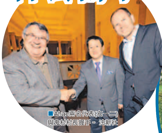
Ahae兩名代表(右一)與鬼村村長握手。