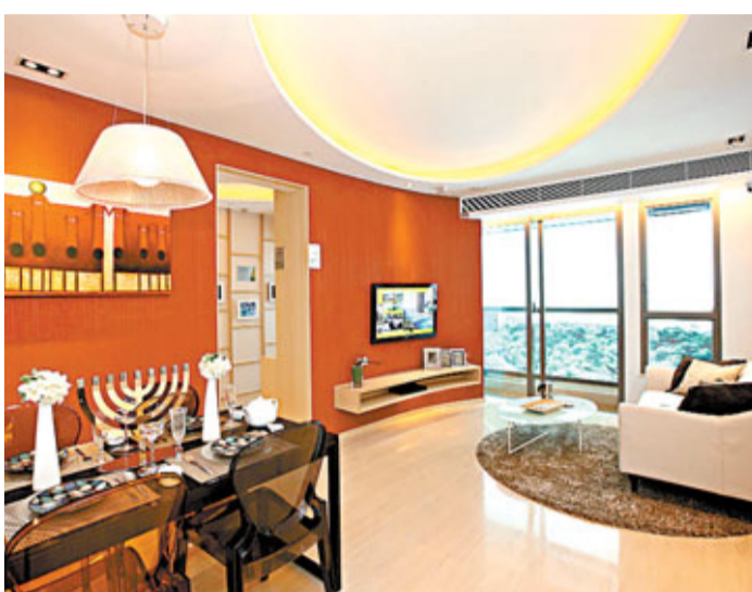
房協為喜雅買家提供最高20%樓價的第二按揭付款計劃,可享2%樓價折扣。