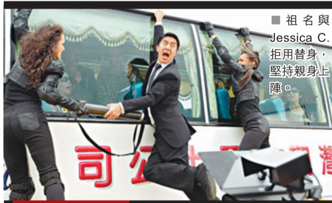
祖名與Jessica C. 拒用替身，堅持親身上陣。

再惹是非，這次城城卻沒像上次般力撐她，反之低調避談，Lynn倒沒表現不高興，更讚城城說：「沒有這個需要，我覺得男人這樣才型型地，不用講太多吧！」但再次受委屈，Lynn也一力承擔責任，說只是自己說話太多了。另報道又指城城對她的工作規限重重，Lynn表示並沒有，她也從沒接過一些「Cheap Job」，每次都是以高貴和靚的一面見大家。至於昨日鞋履活動上被問會否為城城選鞋款？Lynn指試過城城生日本想送鞋，然而似乎又不好意思，所以見到很合城城的鞋，最後也沒買下，她笑指下次最多送完他拿一元來回禮。