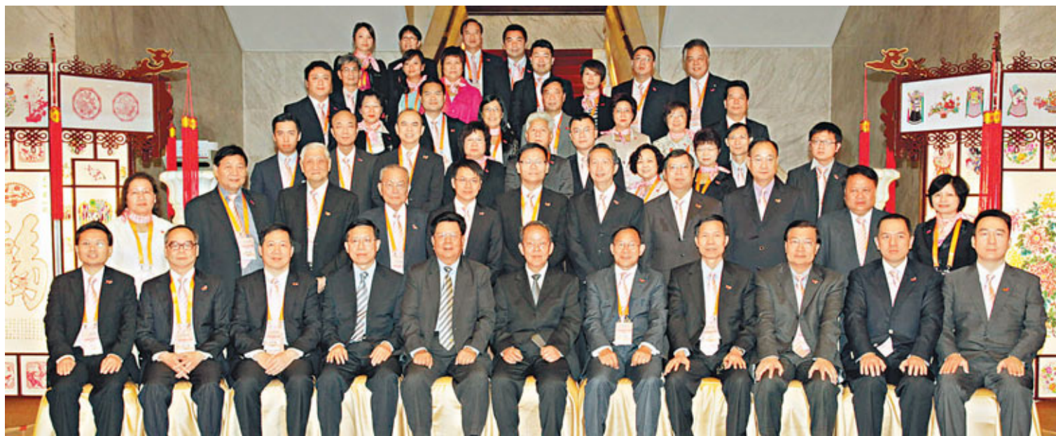
王光亞與新社聯訪京團成員合照。