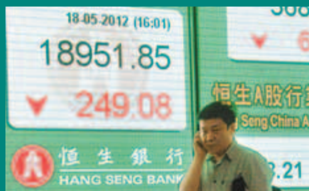
■港股上周失守萬九，一周累計下跌1,013點，而自月初計，12日更累跌2,358點。

18,500點，但不排除若歐債危機有所緩和的話，港股會有一定幅度的反彈，目前反彈的阻力位為19,300點至19,500點，而20,500點則阻力則相當大。她並指出，從目前的情況來看，近期歐債危機難以好轉，若有關情況顯著惡化的話，港股有可能會跌至17,000點。