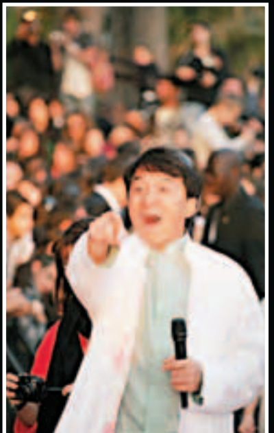
成龍錄影電視節目時，表現興奮。