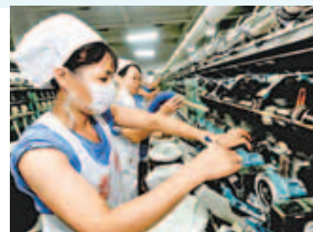
內地存在就業歧視，女性勞動力參與率一直低於男性的參與率。

每一份工作都創造價值，應該得到所有人的尊重，但部分企業僅將勞動者視為機械生產鏈上的一個分子，他們沒有對自身工作及企業的知情權，不可以決定涉及自身的事項，也不能監督企業。正因為此，他們作為零件的勞動者永遠無法得到提升，只能盡自己努力成為最好的零件以獲取多一點工資。