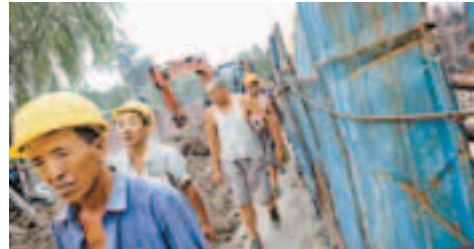
部分企業將勞動者視為機械生產鏈上的一個分子，沒有給予任何升遷機會。資料圖片

近些年來，內地政府及工會組織為進一步保障勞動者權益，在推動體面勞動做了許多努力。《中國工會法》、《勞動法》及《勞動合同法》等法律的制定，以及圍繞着發展和諧勞動關係、建立健全勞動關係協調機制、完善勞動保護機制而推出的一系列社會保障體系、三級服務體系、民主管理制度、廠務公開制度，組織職工依法實行民主選舉、集體合同、勞動就業、三方會議、民主監督等政策措施的推廣，均為保障工人階級和廣大勞動群眾實現體面勞動打下了基礎。