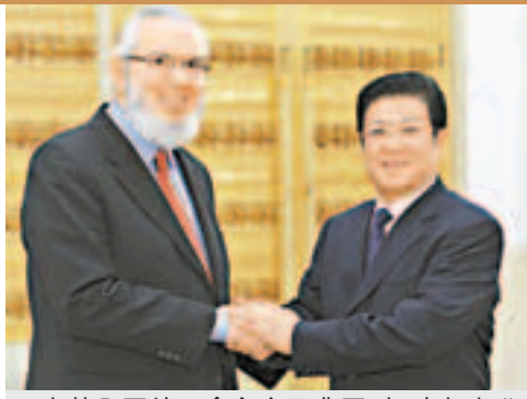
中華全國總工會主席王兆國(右)去年在北京人民大會堂會見國際勞工組織總幹事索馬維亞(左)。資料圖片

充實和豐富。2008年第九十七屆國際勞工大會通過的有關實現公平全球化的宣言就指出，在當前形勢下，關於就業這個戰略目標不僅要求實現充分就業，而且要求創造一種能夠促進就業的可持續、制度化的經濟環境。關於社會保護這個戰略目標，要求把社會保障擴大到人人享有，並適應由於技術、經濟、社會和人口統計的迅速變化而產生的新要求。宣言還提出，關於工資收入、工時和其他勞動條件的政策規定應當保證人人都能公平享有社會發展的成果。