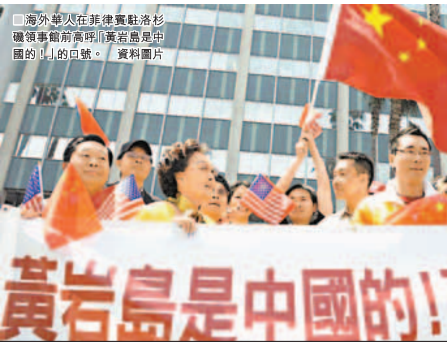
海外華人在菲律賓駐洛杉磯領事館前高呼「黃岩島是中國的！」的口號。資料圖片