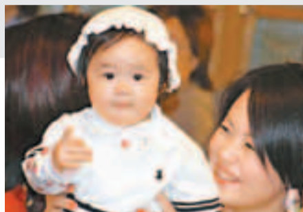
調查揭台灣只有小部分新手母親感到開心。

龍年迎接龍寶寶，新手媽媽的第一個母親節卻不見得開心。根據台灣一項最新調查發現，龍寶寶爆大量，但新手媽媽產後憂鬱指數也節節攀升，有八成以上孕產婦的憂鬱指數都在「紅燈區」，更有六成七的