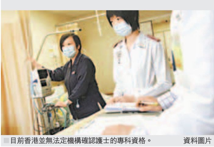
目前香港並無法定機構確認護士的專科資格。