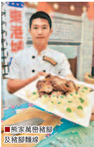
■熊家萬巒豬腳及豬腳麵線