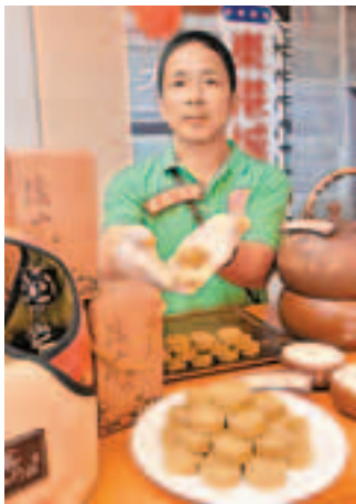
■宜蘭中山休閒農業的綠茶糕，筆者吃過後，感到內含陳皮，口感不錯。