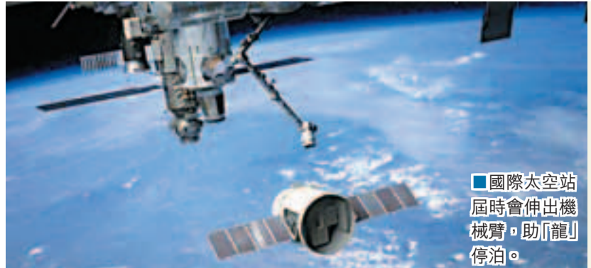
■國際太空站屆時會伸出機械臂，助「龍」停泊。