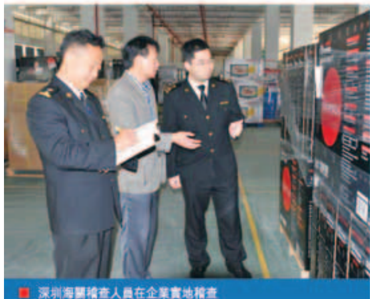
■深圳海關稽核查人員在企業實地稽核查