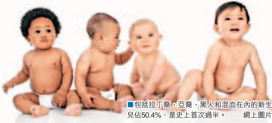
■包括拉丁裔、亞裔、黑人和混血在內的新生兒佔50.4%，是史上首次過半。

南加州大學教授梅爾斯認為：「對美國而言，少數族裔新生兒數量超過白人是好事。歐洲社會移民水平低，過年輕人難以支撐龐大老化人口，加劇經濟問題。如果美國單靠白人新生兒，只會是死路一條。」