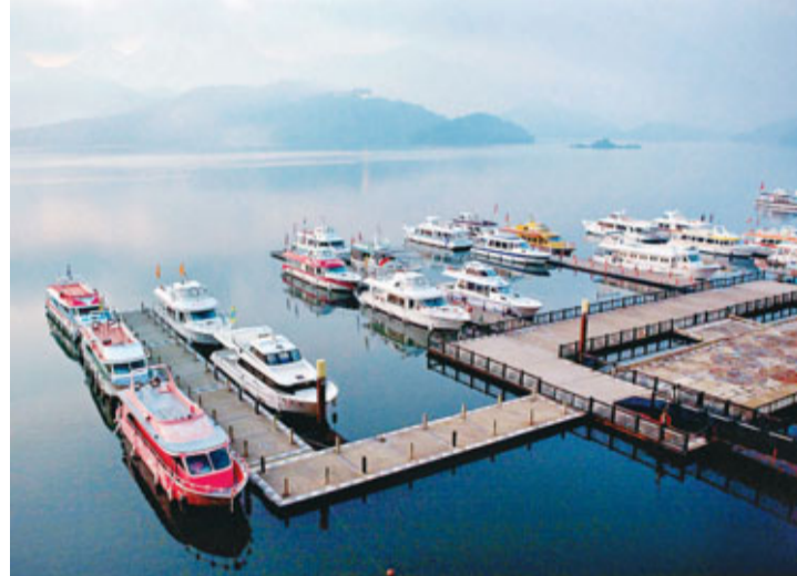
南投日月潭清晨景觀。

李縣長也以台北縣改為新北市為例，說明更改縣名不是不可能，但是一定要全體縣民獲得共識才能改變。議員們拋出議題後，縣府會在縣內舉辦說明會、座談會，聽聽縣民意見，或許可以朝行政特區或觀光特區方式思考，提升南投知名度。議員們也建議舉辦公投，由縣民共同決定，並表示，雖然更改縣名難度不低，但是總要踏出第一步試試看。