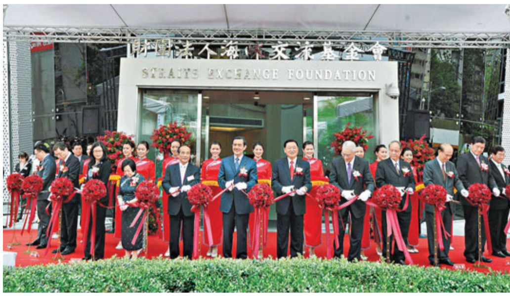
海基會位於台北大直的新大樓18日落成啟用，馬英九（中左）率一眾高官出席剪綵儀式。

馬英九表示，對於因為推動改革而造成民眾的不便及憂慮，他感到非常不安與虧欠，未來一定會再努力檢討改進。改革的目標雖然不會改變，但在可能的情形下做出調整。最後，他連說3次檢討、改進、努力，表示政府絕對會傾聽人民的聲音。