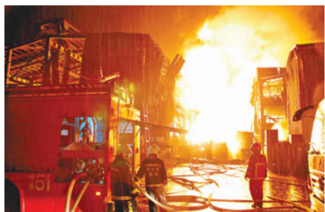
彰化工廠火勢猛烈，消防車只能在工廠外灑水降溫。

香港文匯報訊 綜合報導：台灣彰化縣彰濱線西工業區17日晚8時許，發生營運以來傷亡最慘重的工廠爆炸事件，現場幾乎被夷為平地，造成1死13傷慘劇。