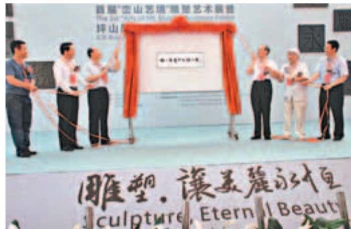
深圳市第八屆文博會分會場「坪山雕塑藝術創意園」揭牌。