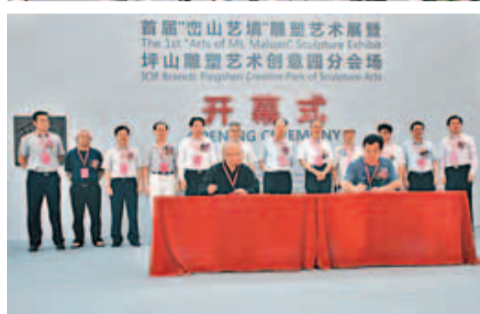
入園藝術家代表簽約。