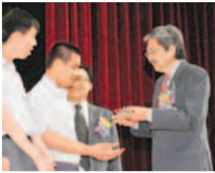
曾俊華(右一)頒發畢業證書予畢業同學。

香港文匯報訊(記者 鄭治祖)財政司司長曾俊華昨日到訪沙田鄉議局大樓,出席服務智障兒童的匡智會聯校畢業典禮。他讚揚匡智會一直支持和配合政府政策和措施,亦會採取主動因應社會的改變和學生的需要,在教育、社福和康復等不同範疇作多元化的發展。他深信每位孩子不論家庭背景、成長年代及怎樣的先天條件,只要有適切的教育,都可以發揮所長,長大後都能夠貢獻社會,做個自強不息,積極向前,既開心又有承擔的人。