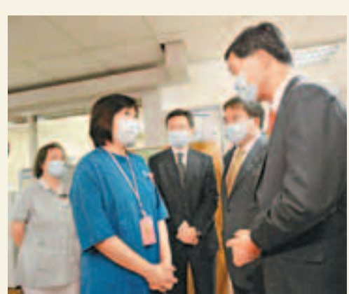
梁振英(右一)昨日下午到沙田威爾斯親王醫院探訪產科醫護人員,為他們打氣。

當局為減少長者的住院需求,亦將推出社區伙伴計劃,撥款予地區志願團體,為部分出院1個月內要重新入院的高危病人,提供出院後的支援服務。對於病情較輕微的患者,當局將推出自強計劃,以加強病人的自我管理,預計住院率可減少25%至40%。