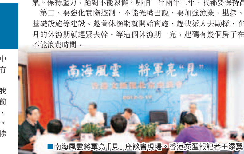
■南海風雲將軍亮『見』座談會現場。

全球樹立一個很好的大國形象。」可見，中國「將軍」們不僅懂得使用拳頭，更具有「上兵伐謀」的智慧與追求。 明朝傑出軍事家戚繼光曾說過：封侯非我意，但願海波平。在場將領一致認為，目前黃岩島對峙已關到關鍵時刻，如果堅持到底，就能把菲軍重大擊垮，爭取主動，立信立威。我們不禁在此感歎：南海風高浪急，黃岩慘遭蠶食，將軍衛寇亮見，何日打鬼驅魔！