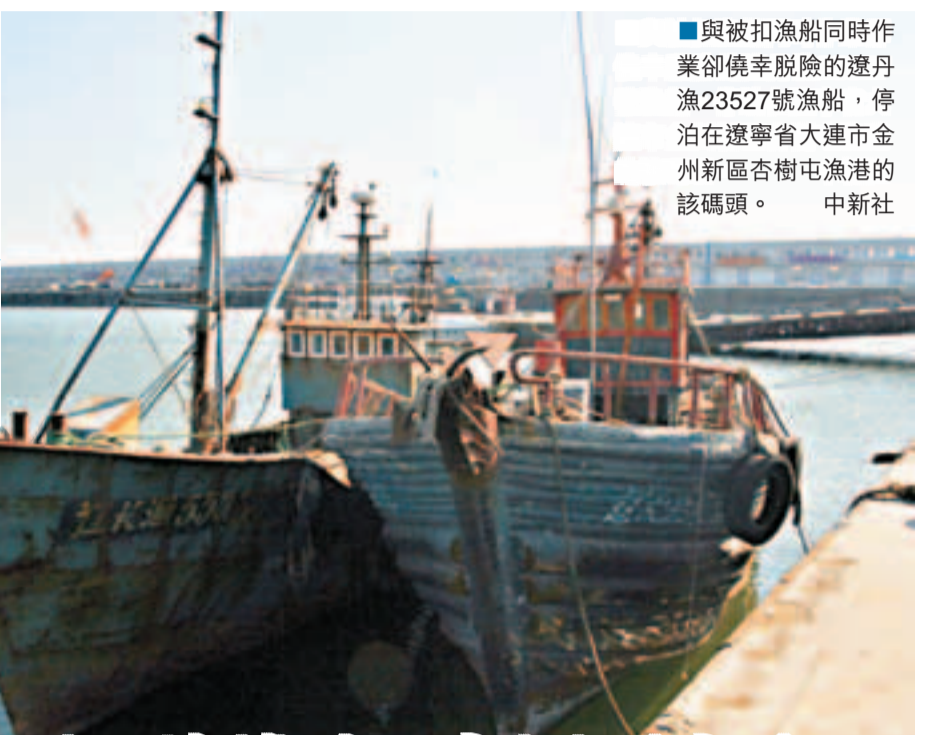
與被扣漁船同時作業卻倖幸脫險的遼丹漁23527號漁船，停泊在遼寧省大連市金州新區杏樹屯漁港的該碼頭。

海域(東經123度57分、北緯38度05分)進行拖網作業，而東經124度才是漁民心目中的中朝兩國海上分界線，故漁船捕魚地點屬於中國海域。8日凌晨，朝方兩艘小艇突然駛過中心線，將中方4艘漁船押往朝方海域。除上述三艘遼丹漁船外，另外一艘登記在大連灣，後來被放走並已返航，獲釋途徑不詳。