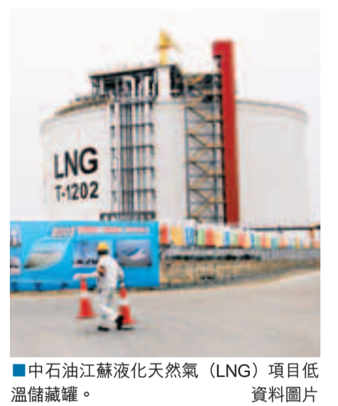
中石油江蘇液化天然氣(LNG)項目低溫儲藏罐。

作為清潔的化石能源，液化天然氣在亞洲和其他市場的需求一直居於高位。這一項目將為所在地原住民、社區、地區乃至