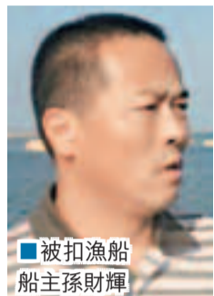
船員安全與合法權益。

香港文匯報訊(記者 趙一存 北京報道)內地三艘漁船29名船員日前在黃海中國海域內被身份不明的朝鮮人扣押，綁匪昨日提出最新要求支付90萬元贖金，並警告17日是最後限期，若拿不到錢就將殺害人質。直至截稿為止，限期已過，船員仍下落不明，生死未卜，船員家屬心急如焚，國人同憂。中國外交部昨表示，中方正通過有關渠道與朝方保持密切溝通，爭取有關問題盡早得到妥善解決，要求朝方確保中國