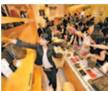
熱情的南京LV支持者們搶購LV挎包。

告同時指出，中國消費人群將從從眾炫耀逐步向個性享受轉變，羅蘭貝格預計，品牌喜好和認同在購買決定中的重要性將上升。