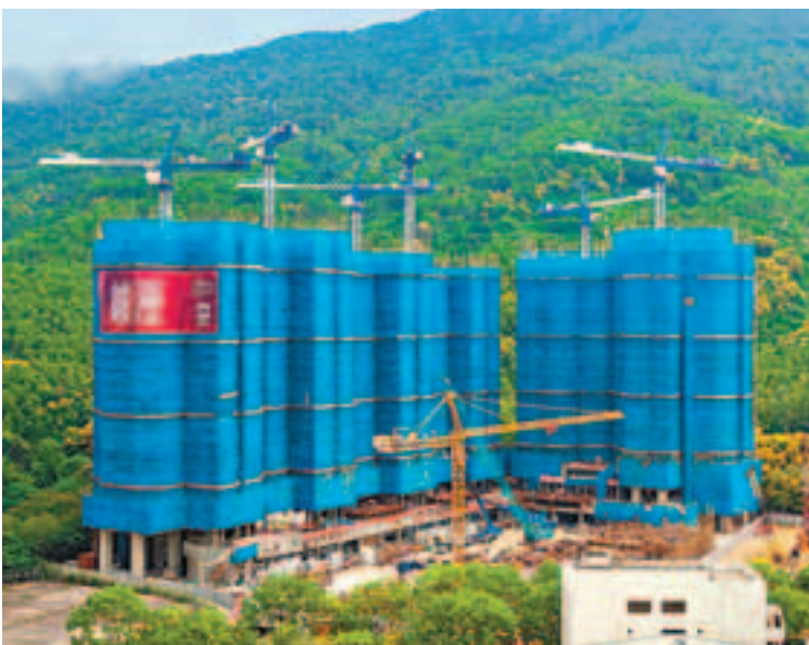
將軍澳峻澄仍待批售樓紙，發展商期望第二季內可推售，首批2房單位入場費料低於500萬元。

65樓頂層複式戶，單位建築面積3,333方呎，呎價37,899元，買家為內地客，計劃作自用。