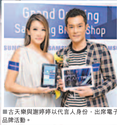
■古天樂與謝婷婷以代言人身份，出席電子品牌活動。