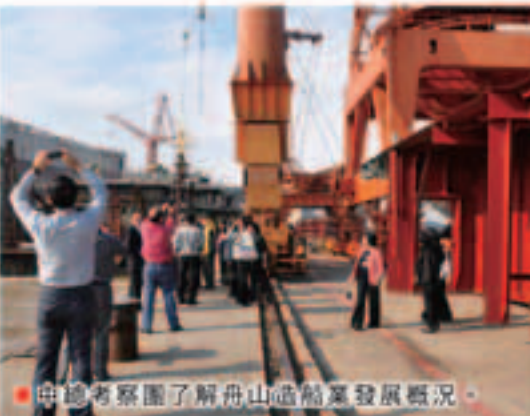
中總考察團了解舟山造船業發展概況。