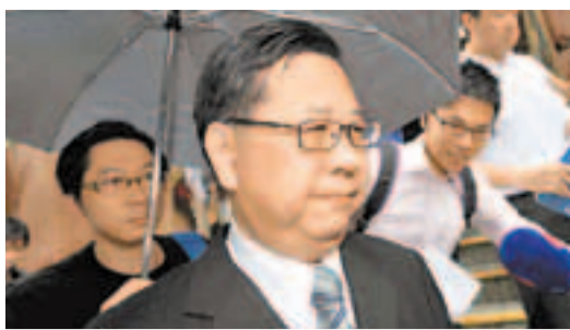
地政總署助理署長樊容昌認詐騙房津160萬元。