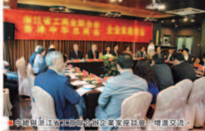
中總與浙江省工商聯合會企業家座談會，增進交流。