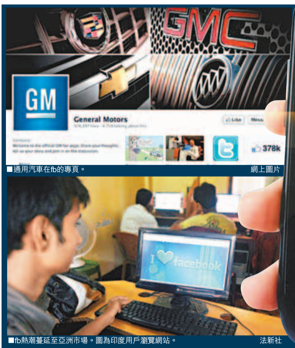
通用汽車在fb的專頁。