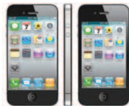
疑是iPhone5的屏幕(圖左)，與iPhone4S的屏幕(圖右)比較。

據稱，蘋果向3家亞洲生產商訂購新屏幕，包括韓國LG、日本聲寶及日本官商合資企業「Japan Display」。