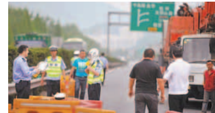
16日,杭州危化品車相撞事故後,當地政府已轉移事故地附近萬人。圖為救援人員戴上防毒面具,準備吊走失事車罐。

香港文匯報訊(記者 潘恆 杭州報道)兩日前的一則交通事故造成疑似化工原料洩露,杭州在16日最終確定施救方案,事故地附近居民實行萬人大轉移。