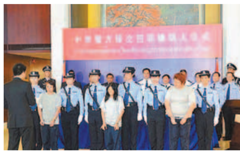
泰籍犯罪嫌疑犯由泰國警方核實身份後帶離。

助開展偵查。在公安部的指揮下,廣東警方經過一個多月調查取證,於5月9日展開收網行動,一舉摧毀了這個專門詐騙泰國國民的跨國電信詐騙集團,抓獲犯罪嫌疑犯12名,其中泰國人10名,繳獲銀行卡、電腦、手機、網絡平台服務器等一大批作案工具和贓