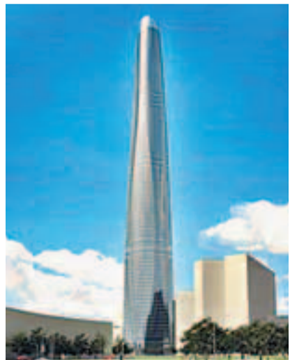
周大福濱海中心效果圖。

據了解,天津周大福中心由香港周大福集團投資建設。地處濱海新區現代服務產業區MSD規劃範圍內,其中地上塔樓高97層,地下4層,還有5層連接塔樓的裙房。建成後將成為集商場、國際標準甲級寫字樓、最高服務標準的酒店式公寓及超五星酒店為一體的綜合性大樓。該中心還運用各種具有高性能及綠色環保的設計手法,顯著減低二氧化碳排放量、用水量及高峰耗電量,大大減少建築對自然環境的影響。