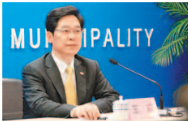
王毅表示，增加了進口消費品主題展，符合「渝洽會」以「拉動進口」為主的發展定位。