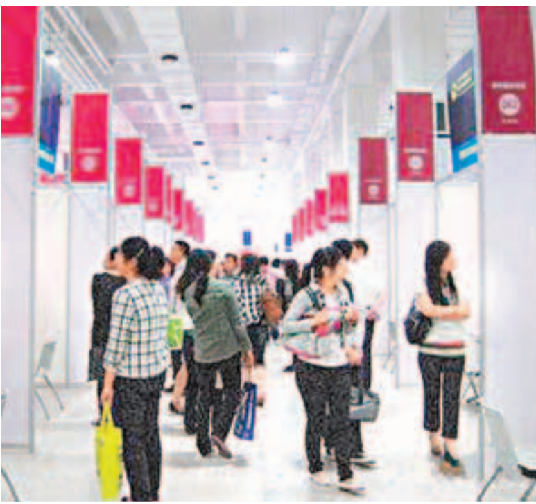
津洽會人才智力交流洽談活動。