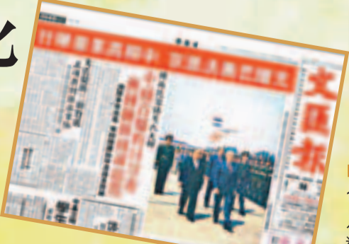
■本報1989年5月16日報道版面。

5月17日，戈爾巴喬夫向中國學術界人士發表演講，並舉行了記者招待會。18日，中國和蘇聯發表了一項聯合公報，共18條。當天，戈爾巴喬夫一行離開北京到上海參觀訪問，隨後回國。