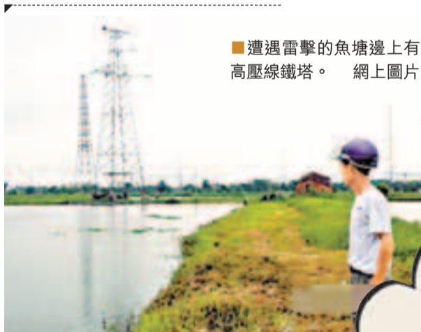
■遭遇雷擊的魚塘邊上有高壓線鐵塔。