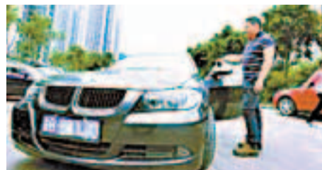
寶馬哥和他的愛車。 網上圖片