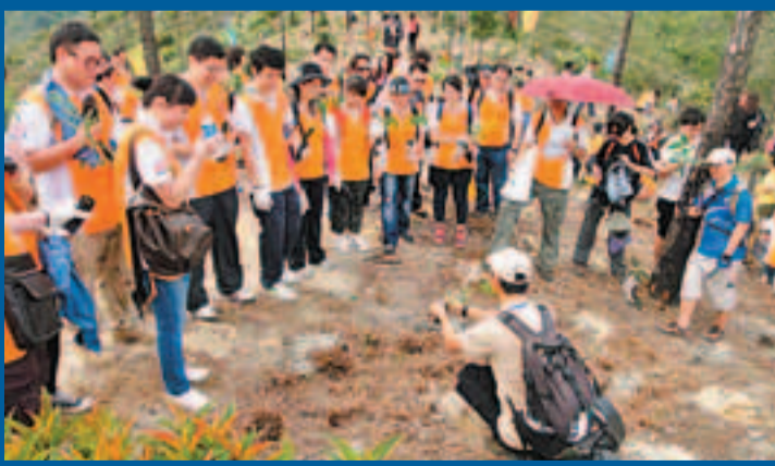
新地義工細心聆聽護樹專家授課技巧，及後協助指導市民植樹。

新鴻基地產(新地)向來重視環境保護，策動「新地G能量」進一步推展環保動力，積極舉辦及支持各項環保活動。日前150名義工及其家屬參與遠足植樹日，與市民一同身體力行，協助栽種近2,000棵樹苗，為綠化香港盡一分力。