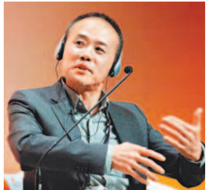
萬科集團董事長王石去年出席新加坡「慧眼中國」環球論壇。