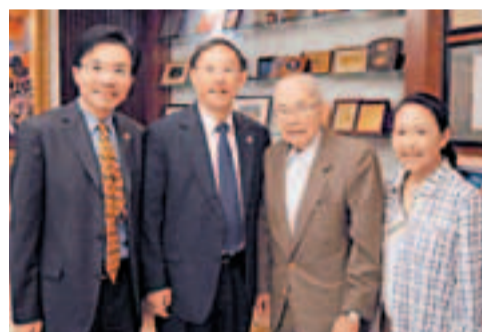
復旦大學副校長馮曉源一行與方潤華及吳方笑合影。

香港文匯報訊 復旦大學副校長馮曉源一行日前訪港，並專程拜訪了方潤華基金主席方潤華等人，受到熱情歡迎及接待。