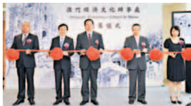
澳門經濟文化辦事處在台舉行開幕儀式。

今屆「最佳中小企業獎」得獎機構為磁磚王(香港)、金田珠寶、美億珠寶(香港)、穎明實業、銀龍飲食集團、同發號建築材料、永恒洋行醫療用品、Wing Tat(HK)Trading Limited、盛創亞洲、古迪設計、唯一國際、芥菜種。