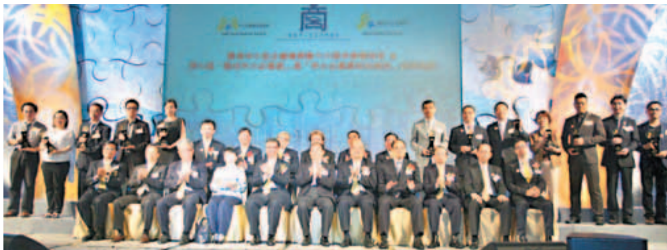
「最佳中小企業獎」獲獎企業和總商會會長、各界嘉賓合照。

香港文匯報訊（記者 沈清麗）香港中小企業總商會成立16周年晚宴暨第七屆「最佳中小企業獎」及「中小企業最佳拍檔獎」頒獎典禮，日前假灣仔會展舊翼會議廳舉行。今屆共有12家企業在「最佳中小企業獎」選舉中獲得殊榮。另外有24家企業及機構獲得「中小企業最佳拍檔獎」。大會筵開70席，逾700位政府官員、各界嘉賓和業界人士共同見證，場面熱鬧。