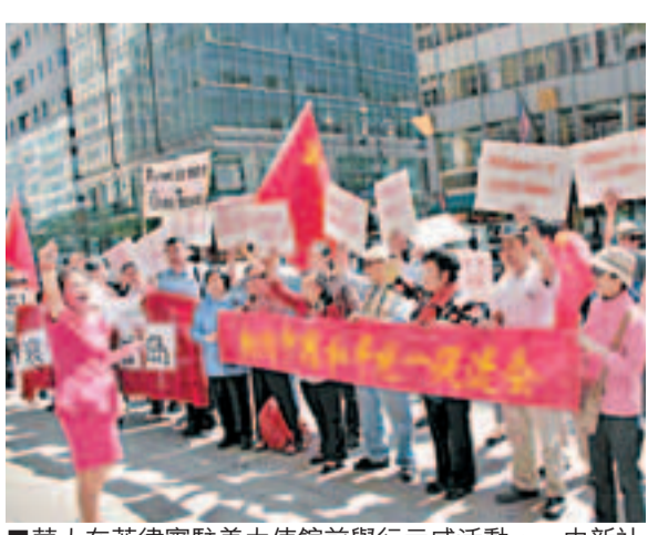
■華人在菲律賓駐美大使館前舉行示威活動。

香港文匯報訊 據人民網報道, 美國華人於當地時間13日上午在菲律賓駐美國大使館前舉行示威活動, 宣示堅決支持中國維護黃岩島主權, 嚴正警告菲律賓侵權行為。菲律賓駐美國大使館位於華盛頓馬薩諸塞街1600號。自13日上午10時至11時30分, 美國華人在菲律賓駐美使館前舉行示威活動。示威者手拉寫有「菲律賓立即撤出黃岩島」、「黃岩島是中國固有領土」、「黃岩島是我們的」等大幅標語, 呼喊「黃岩島屬於中國」等口號, 表達對菲律賓政府南海問題立場的抗議。