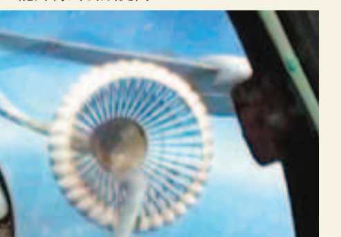
■在4,000米高空, 飛行員駕駛戰機緩緩靠近, 一次對接加油成功。 網上圖片

空中加油訓練是衡量現代空戰能力重要標誌之一, 戰機經過空中加油能夠極大提高戰機的作戰半徑、機動航程、有效載荷和滯空時間, 縱深突擊能力和戰場生存能力得到明顯提高。