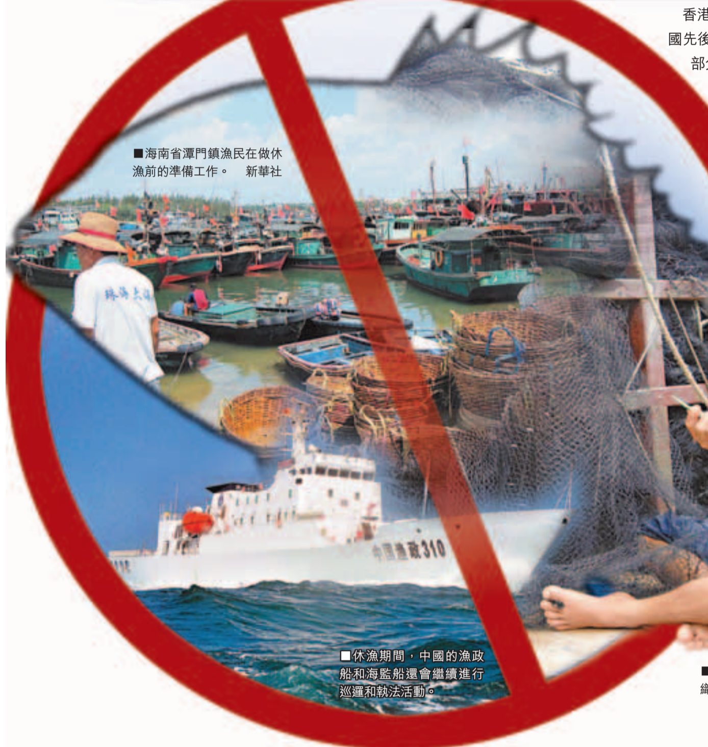
■海南省潭門鎮漁民在做休漁前的準備工作。