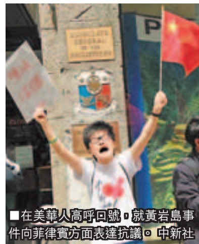
■在美華人高呼口號, 就黃岩島事件向菲律賓方面表達抗議。

香港文匯報訊 據人民網報道, 美國華人於當地時間13日上午在菲律賓駐美國大使館前舉行示威活動, 宣示堅決支持中國維護黃岩島主權, 嚴正警告菲律賓侵權行為。菲律賓駐美國大使館位於華盛頓馬薩諸塞街1600號。自13日上午10時至11時30分, 美國華人在菲律賓駐美使館前舉行示威活動。示威者手拉寫有「菲律賓立即撤出黃岩島」、「黃岩島是中國固有領土」、「黃岩島是我們的」等大幅標語, 呼喊「黃岩島屬於中國」等口號, 表達對菲律賓政府南海問題立場的抗議。