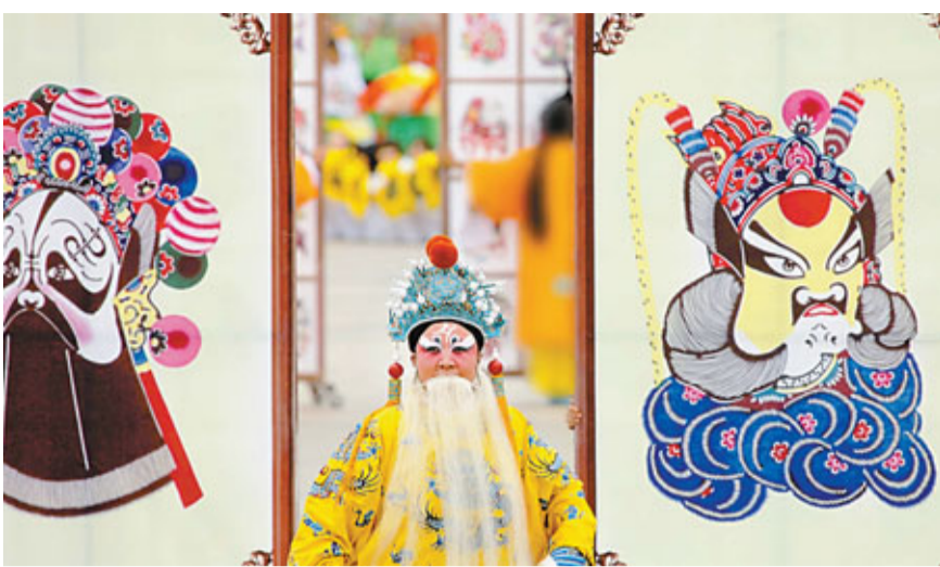
蔚縣剪紙年產值已達4億元,圖為蔚縣國通剪紙廠的展出作品。

有限公司等上百家文化龍頭企業的孕育出爐,該市蔚縣剪紙、影視基地、壩上「二人台」等形成多條文化產業鏈,年產值達到16億元,文化和產業相結合的路子越走越寬。