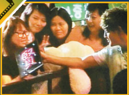
■金賢重送熊公仔給台下粉絲。

專線：2873 8075 傳真：2873 2453 電郵：feature@wenweipo.com