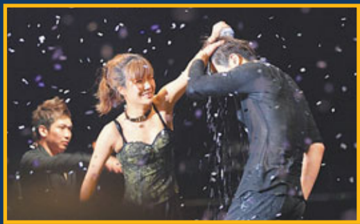
■金賢重被女舞蹈員偷襲，照頭淋。