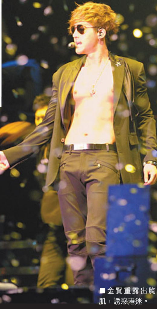
■金賢重露出胸腹肌，誘惑港迷。

安歌時，他突然在觀眾席後方出現，一邊唱歌，一邊與粉絲握手，雖然有保安護住，但他仍然被粉絲包圍到寸步難行，很辛苦才返回台上。不過，他心情甚好，不時拿水潑向粉絲，亦慘被舞蹈員射到全身濕透。完騷後，他與在場每位粉絲逐一握手，並多次以英文「多謝」感謝大家的支持。昨早他則乘搭8時的飛機往北京出席中國4站巡唱的記者會，獲150名粉絲送機。