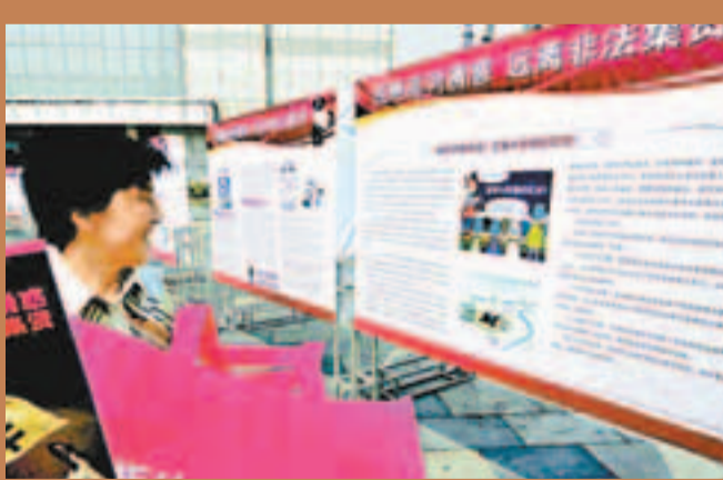
■政府在社區舉行展覽，教育群眾慎防非法集資所騙。