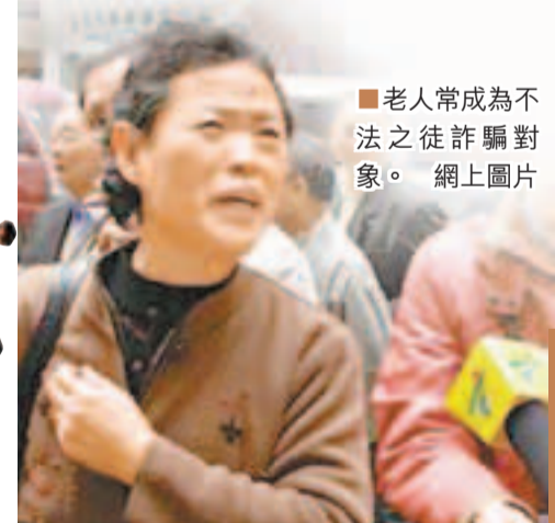
■老人常成為不法之徒詐騙對象。