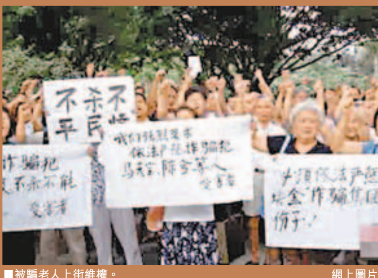
■被騙老人上街維權。

民間借貸風行，利息較銀行高上近十倍的高利貸令不少農村老人也難抵誘惑，將畢生存款，甚至是「棺材本」孤注一擲。