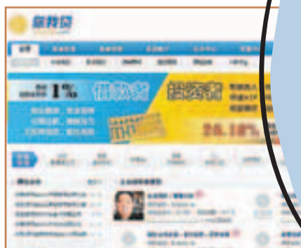
■民間借貸網絡平台猖獗。

在各種靠地緣等關係搭建起來的民間借貸方式之外，雙方互不相識，單靠網絡平台就能借貸或放貸的網絡借貸模式在廣東也隨處可見，有的甚至號稱能出資幾十億。 記者在網絡搜索引擎上輸入「借貸」、「網絡平台」等關鍵詞，馬上就可以看到多家聲稱提供「民間借貸網絡平台」的網站出現。少則數千上萬，多則數百萬。記者登錄多家借貸網站看到，網上借錢的用途大致可以分為兩大類，一類是用於消費類資金周轉，比如裝修、買車等；另一類則是企業借款，如創業前期投入、系統工程融資等。 有網站甚至號稱能進行房地產收購、股票抵押買賣等項目，記者在一家網站還見到其說明指，深圳市以外地區項目需借款金額一千萬元以上，單一項目可放款幾十億元，資金在公司評審後3至7天內便可到。