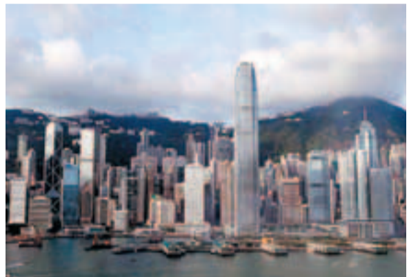
■中資民企正在利用香港充沛的流動性籌集資金。

香港文匯報訊 對香港聯貸市場來說,中資公司境外融資是一個重要的交易來源,佔第一季香港38.6億美元貸款額的近40%。儘管中國今年年初放寬了信貸政策,本可以吸引公司回內地融資,但中資公司仍青睞於境外