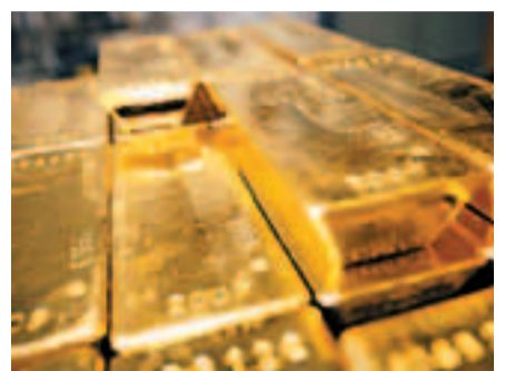
金價昨低見1,573美元一盎司,令今年的漲幅消失殆盡。

香港文匯報訊(記者 周紹基)受歐債危機升溫影響,加上全球經濟增長不明朗,令近期商品市場紛紛重挫,繼油價跌破每桶100美元後,金價也跌破1,600美元大關,昨日低見1,573美元一盎司,令金價今年的漲幅消失殆盡。金價在跌穿1,600美元後,未有資金踴躍入市低吸,令金價進一步下挫至1,573美元。昨晚7時左右,金價報1,580美元。除了黃金以外,白銀、鉑金等貴金屬價格也齊齊向下,三者都創今年1月以來新低。