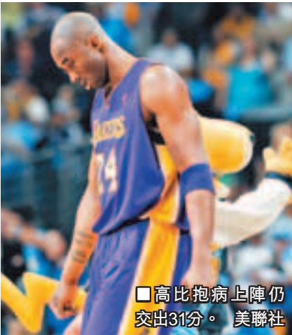
■高比抱病上陣仍交出31分。