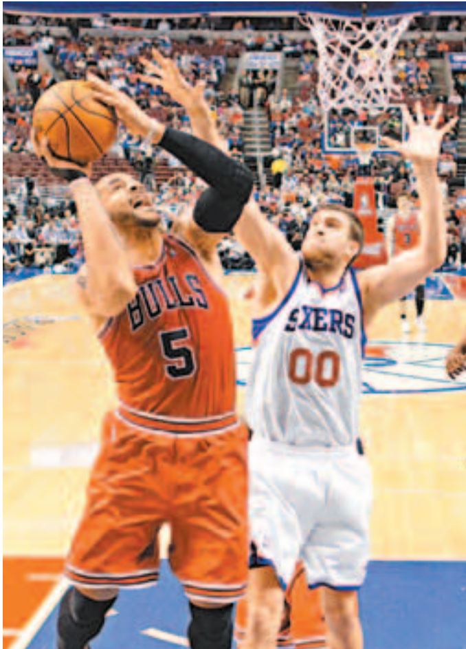
■公牛保沙(左)上籃, 76人夏維斯賴長莫及。