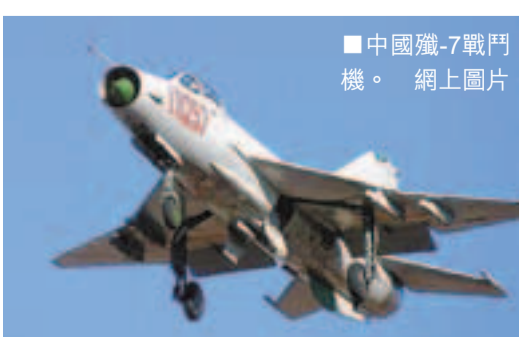
■中國殲-7戰鬥機。

號，性能與米格-21F類似。俄媒稱，自上世紀60年代末以來，中國已向阿爾巴尼亞、孟加拉國、埃及、津巴布韋、伊拉克、伊朗、朝鮮、緬甸、巴基斯坦、蘇丹、坦桑尼亞和斯里蘭卡12國提供了約500架各種改型的殲-7系列戰機。