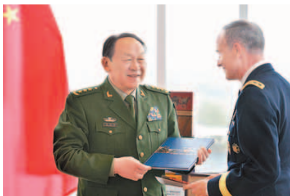
10日，梁光烈訪問美國西點軍校，向西點軍校校長大衛·亨頓中將贈送圖書。

梁光烈此行是中國國防部長時隔9年後再次訪美。在結束美國行程後，梁光烈一行於10日中午轉道前往拉脫維亞、波蘭繼續進行訪問。