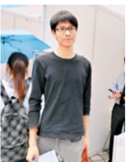
朱同學指, 跨區車費貴, 不願出外工作。