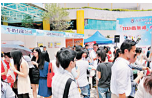
「青年就業招聘日」提供近1,800個職位, 吸引超過2,000人入場。

香港文匯報訊(記者 曹晨) 今年是香港高中的「雙軌年」, 新制的文憑試學生及「未代高考生」, 齊齊爭學位、爭職位, 當中尤以東涌區青年因交通成本, 跨區工作的難度高。有團體昨日於東涌舉辦青年就業招聘會, 提供近1,800個職位, 部分更在區內上班, 全職月薪高達1.5萬元, 兼職及暑期工時薪介乎30元至50元不等,