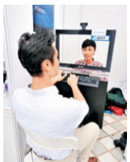
工作人員即場進行模擬「網上面試」。