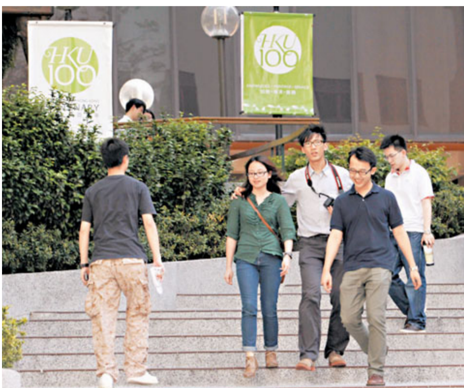
港大2011年畢業生就業率超過八成, 月薪亦較前年增加5.8%至1.8萬元。

未來數月又是畢業生搵工旺季, 陳秉光估計情況會繼續向好, 特別是工程界別; 而金融界別則可能會凍結招聘人數, 不過當中的零售銀行業務或會有不俗的發展前景, 畢業生毋須過分擔心。